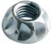
Ecrou Kinmar™ Permanent