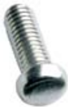
Vis tête oval