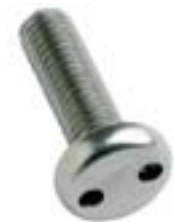
Vis 2 trous