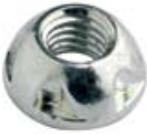
Ecrou Kinmar™ Dévissable