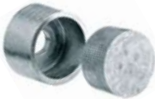
Nogo™ Cache Haute sécurité