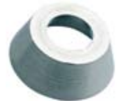
Armour Ring™ Cache sécurité