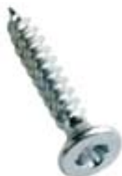
Vis à bois Sentinel™

Vous travaillez dans les domaines suivants: