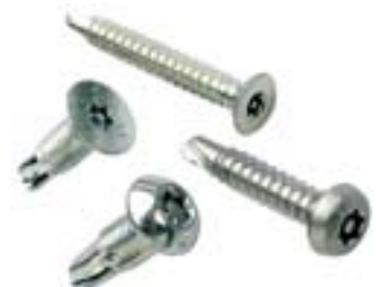
Vis autoperçuses inviolable

QUELQUE SOIT VOTRE ACTIVITE, NOUS AVONS LA SOLUTION