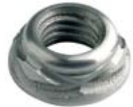
Scroll Nut™ écrou sécurité